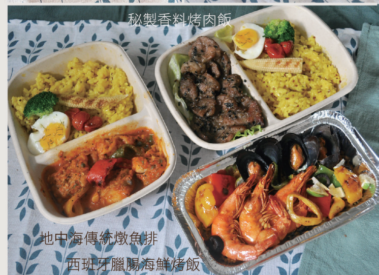
地中海傳統燉魚排