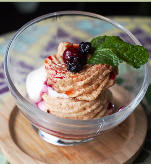
英式莓果蛋白霜 Eton Mess $160