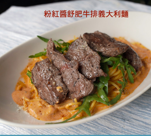
粉紅醬舒肥牛排義大利麵