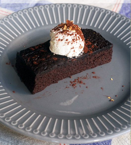
👑 黑啤酒巧克力蛋糕 Dunkel Chocolate Cake $150