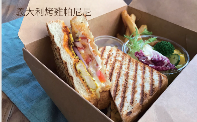
義大利烤雞帕尼尼