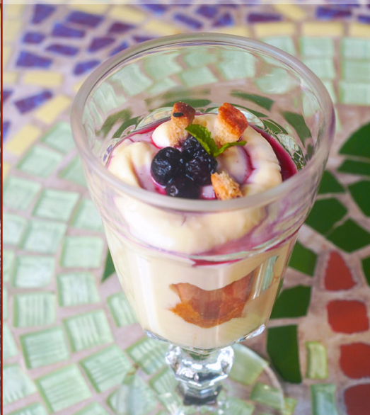
英格蘭咖啡酒軟式布丁 Pudding with Espresso and Brandy $150