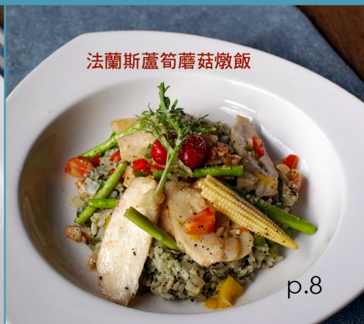
法蘭斯蘆筍蘑菇燉飯