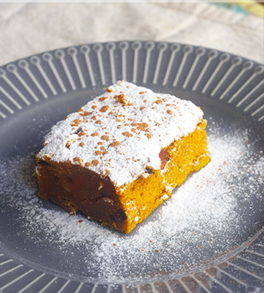
瘋狂蘿莉南瓜蛋糕 Loli-Crazy One Cake $160