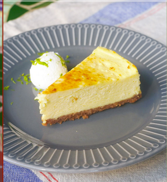
House起司蛋糕 $160 House Cheese Cake