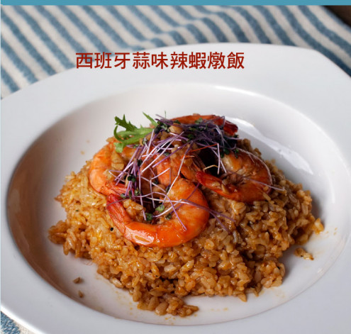
西班牙蒜味辣蝦燉飯