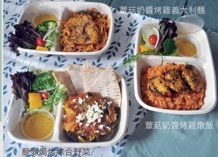
蕈菇奶醬烤雞燉飯