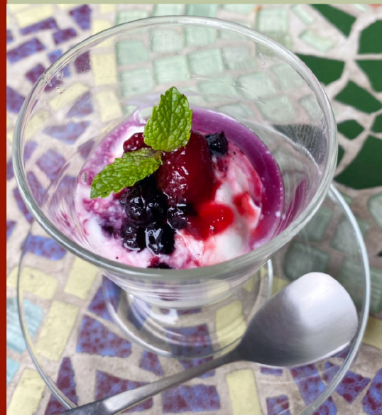
莓果希臘優格 $150 Fruit Greek Yogurt