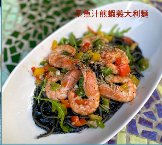
墨魚汁煎蝦義大利麵