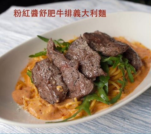
粉紅醬舒肥牛排義大利麵