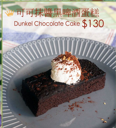
可可抹醬黑啤酒蛋糕 Dunkel Chocolate Cake $130