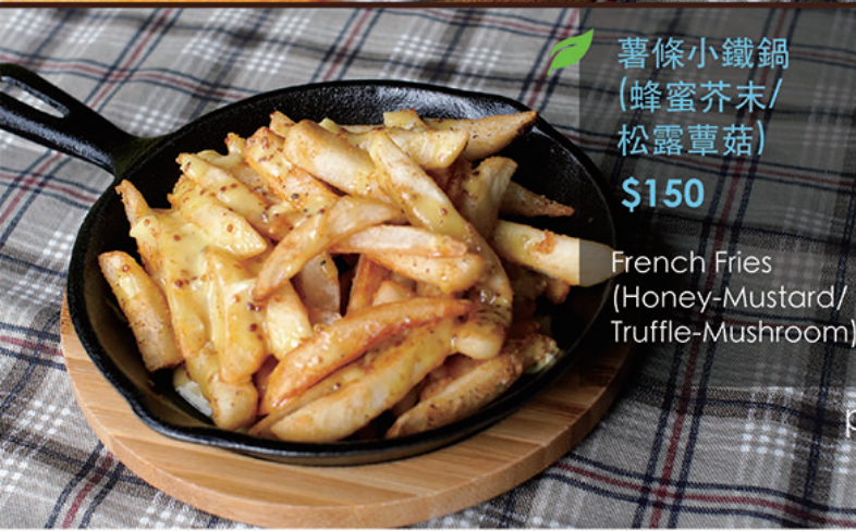
🌿 薯條小鐵鍋 (蜂蜜芥末/ 松露蕈菇) $150 French Fries (Honey-Mustard/ Truffle-Mushroom)