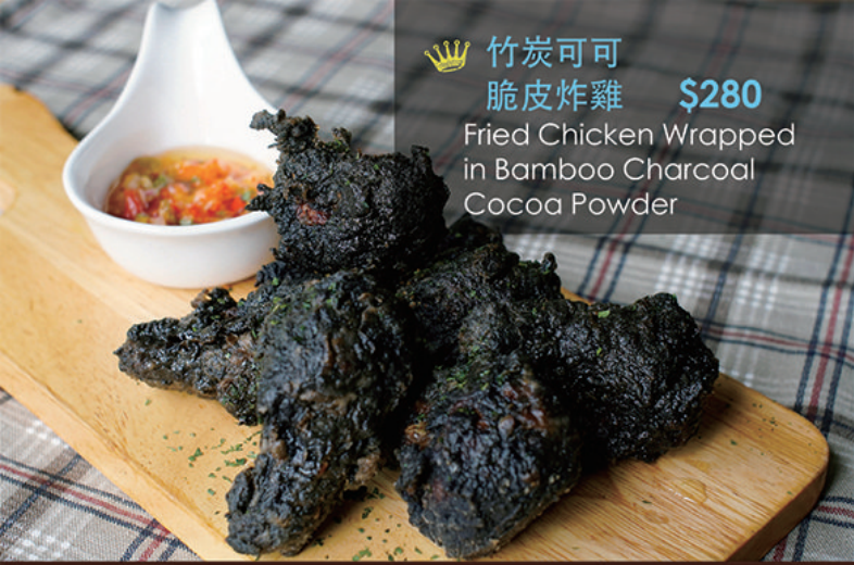
👑 竹炭可可 脆皮炸雞 $280 Fried Chicken Wrapped in Bamboo Charcoal Cocoa Powder