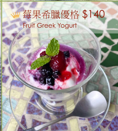
莓果希臘優格 $140 Fruit Greek Yogurt