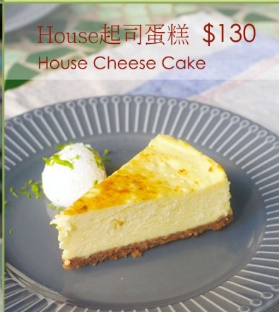
House 起司蛋糕 $130 House Cheese Cake