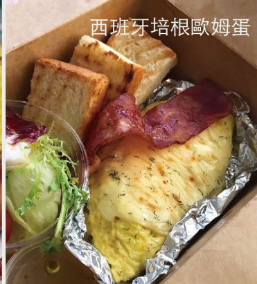
西班牙培根歐姆蛋