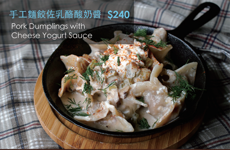
手工麵餃佐乳酪酸奶醬 $240 Pork Dumplings with Cheese Yogurt Sauce