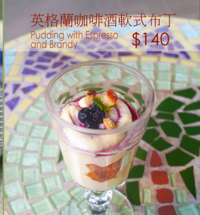
英格蘭咖啡酒軟式布丁 Pudding with Espresso and Brandy $140