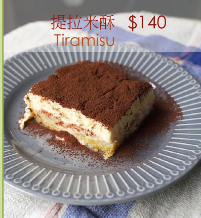
提拉米酥 $140 Tiramisu