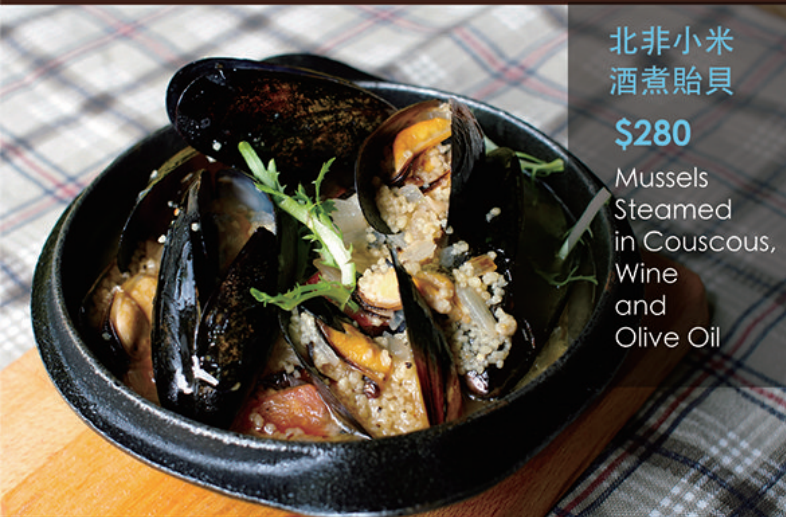
北非小米 酒煮貽貝 $280 Mussels Steamed in Couscous, Wine and Olive Oil