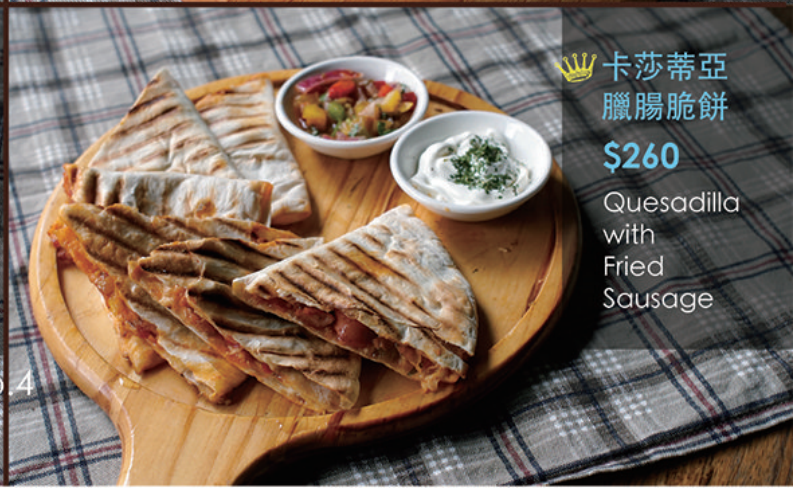
👑 卡莎蒂亞 臘腸脆餅 $260 Quesadilla with Fried Sausage