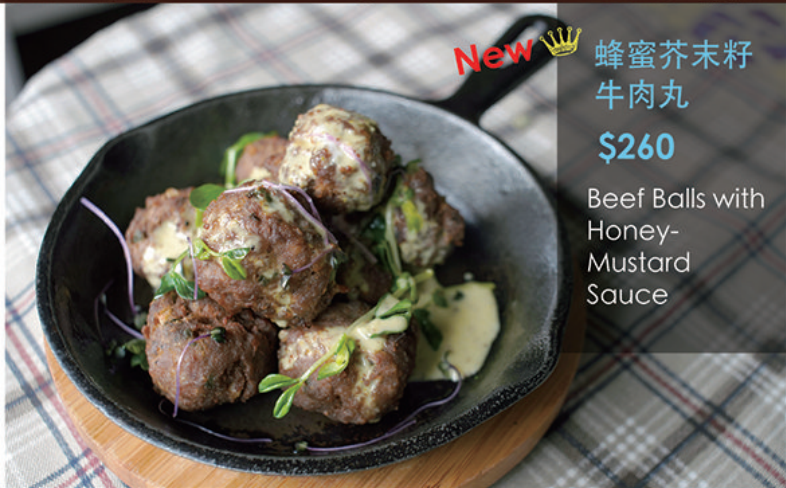
New 👑 蜂蜜芥末籽 牛肉丸 $260 Beef Balls with Honey- Mustard Sauce