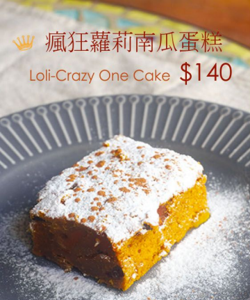
瘋狂蘿莉南瓜蛋糕 Loli-Crazy One Cake $140