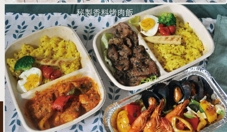
地中海傳統燉魚排