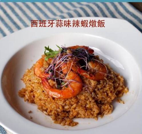
西班牙蒜味辣蝦燉飯