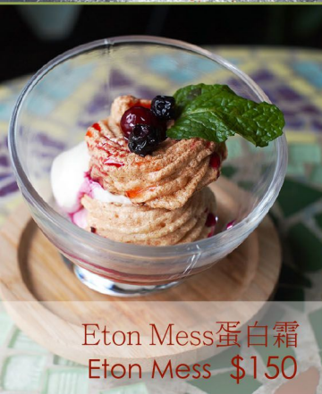
Eton Mess 蛋白霜 Eton Mess $150