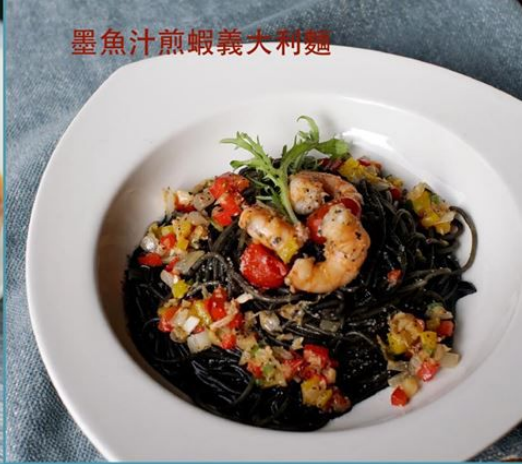
墨魚汁煎蝦義大利麵