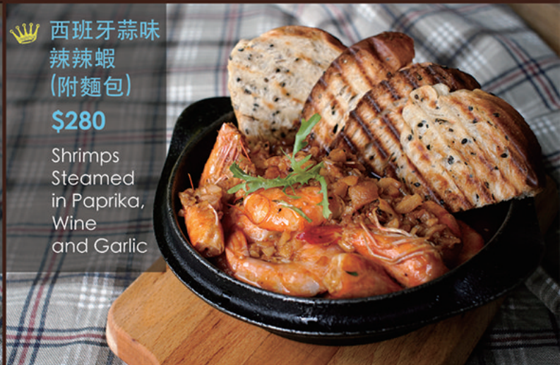
👑 西班牙蒜味 辣辣蝦 (附麵包) $280 Shrimps Steamed in Paprika, Wine and Garlic