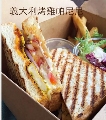
義大利烤雞帕尼尼