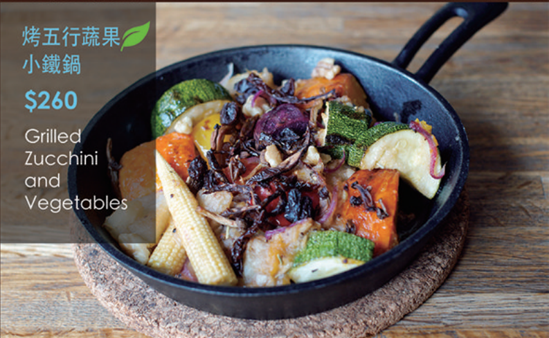
🌿 烤五行蔬果 小鐵鍋 $260 Grilled Zucchini and Vegetables

+ 140元 選二項 +180元 選三項 例湯 / 升等特調飲料任選 / 甜點任選 +140 Get 2 +180 Get 3 From Soup / Beverages / Desserts