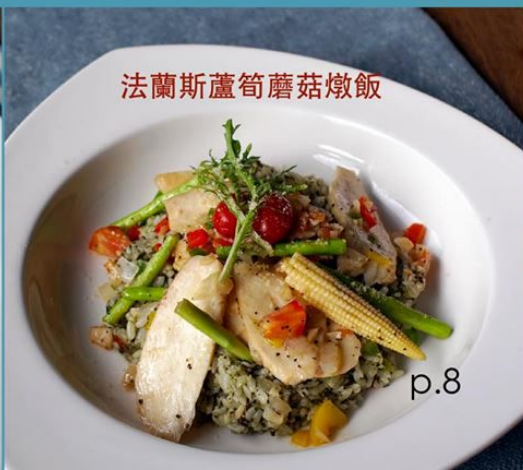
法蘭斯蘆筍蘑菇燉飯