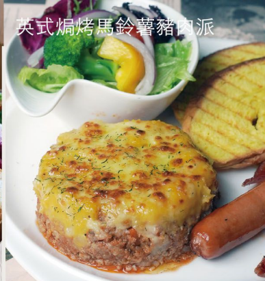
英式焗烤馬鈴薯豬肉派